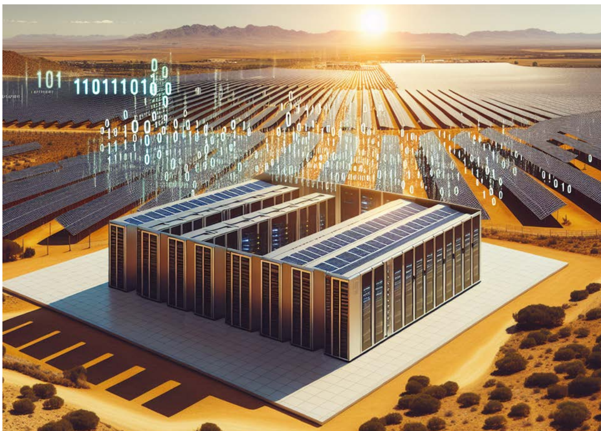
Bild 2: Erneuerbarer Strom für grosse Datenzentren ermöglichen (Cotting, R., kreierte Bild mit KI DALL-E3)

Mit dem Boom generativer KI-Anwendungen hat sich der Stromverbrauch aller Datenzentren in den USA von 2020 bis heute auf über 150 TWh/Jahr mehr als verdoppelt, was etwa dem 2.5-fachen des Stromverbrauchs der Schweiz entspricht.